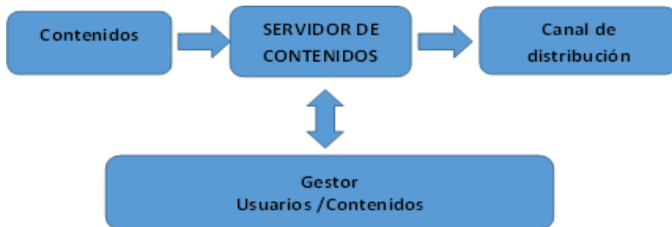
Gráfica 4– Procesamiento de señal en una plataforma IPTV

ya que los contenidos son ubicados en un servidor para ser entregados al usuario/suscriptor por petición, no llegando simultáneamente hasta el aparato receptor de este. Se contempla en este caso un sistema de gestión de usuarios y contenidos con la capacidad de atender las peticiones de todos los suscriptores.