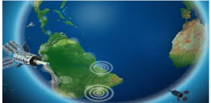
IMAGEN DEL PROYECTO